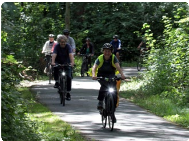
Wege durch Wald und Wildnis