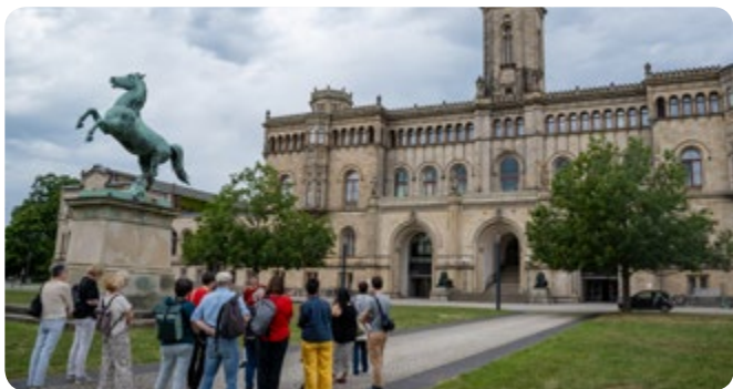
Welfenschloss und Wissenschaft