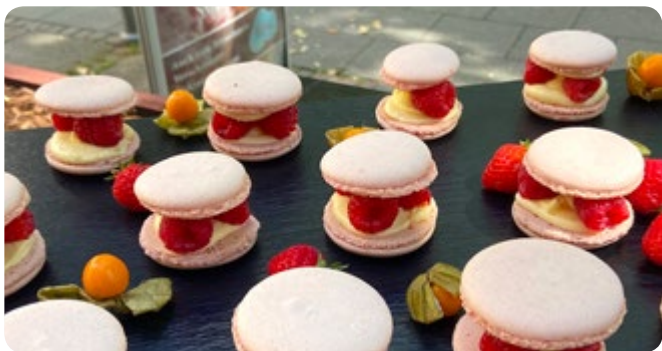
Hannover häppchenweise – Vielseitig lecker!