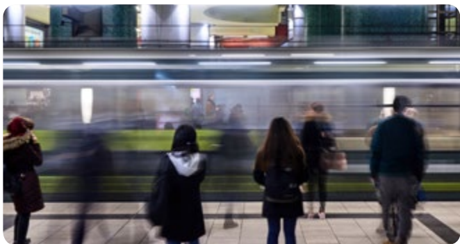
Stadtbahn, U-Bahn und ein großes Loch