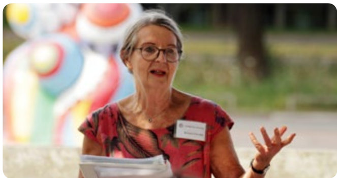
Frauen, die sich trauen