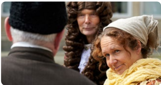
Leibniz und die Kartoffeln des Zaren