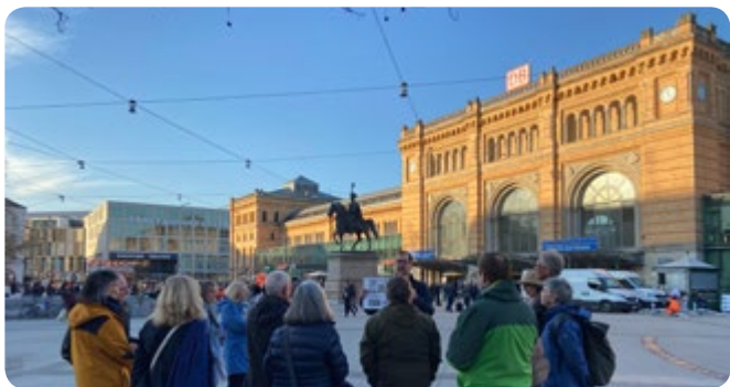
Der Hauptbahnhof Hannover