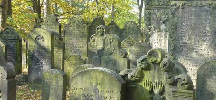
Beth-Olam – Haus der Ewigkeit