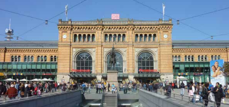
Der Hauptbahnhof Hannover